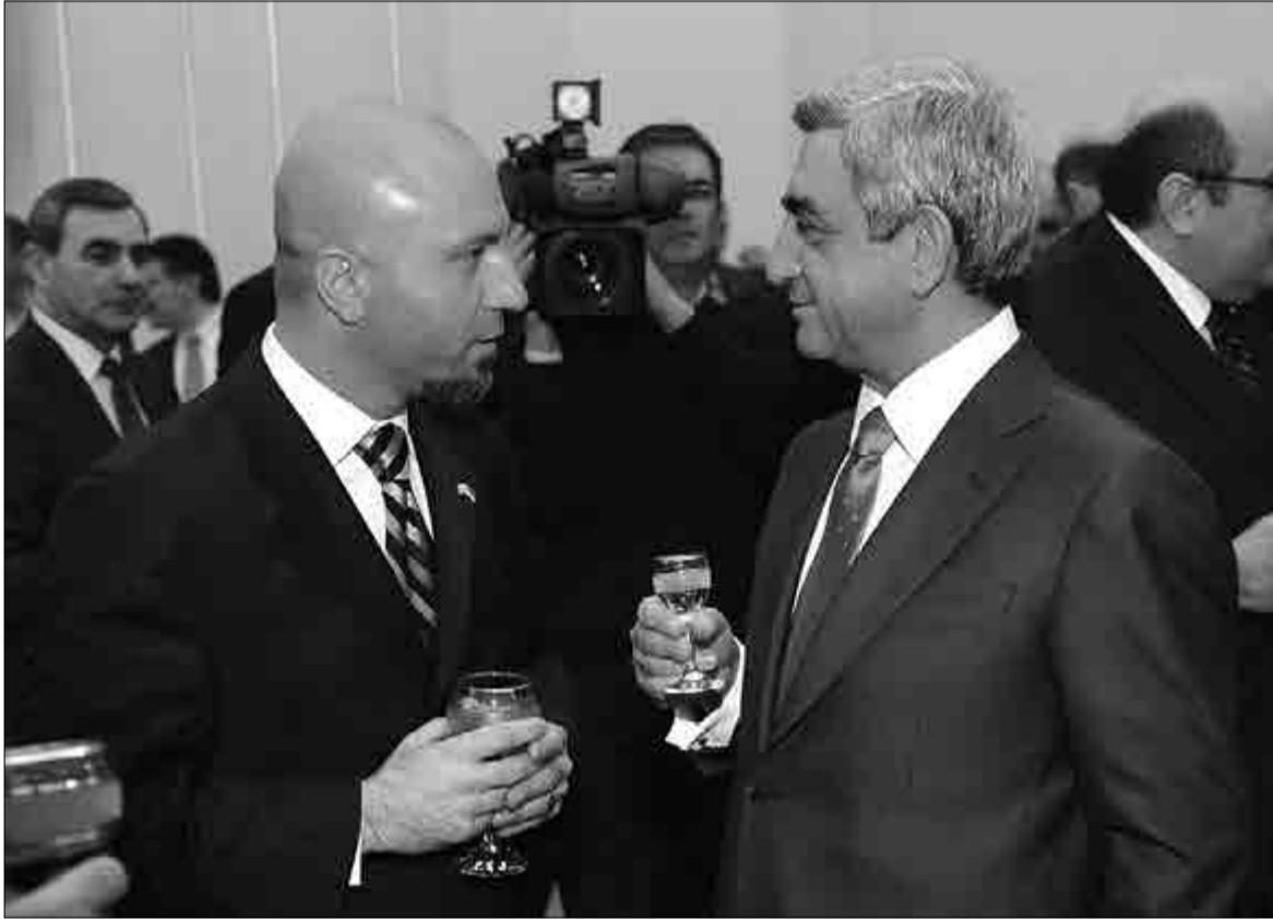
ՀՀ նախագահ Սերժ Սարգսյանը եւ «Դինո գոլդ մայնինգ քամփնի» ՓԲԸ վարչական տնօրեն Հրաչ Զաքրայանը

Ինչպես արդեն հաղորդվել է, ս.թ. հունվարի 22-ին ՀՀ նախագահ Սերժ Սարգսյանն այցելել է Կապանի «Դինո գոլդ մայնինգ քամփնի» ՓԲԸ ընկերություն, որի ղեկավար կազմի հետ հանդիպման ժամանակ ՓԲԸ վարչական տնօրեն Հրաչ Զաքրայանը ՀՀ նախագահին է ներկայացրել համառոտ տեղեկատվություն ձեռնարկության գործունեության մասին: Հրաչ Զաքրայանի ելույթը՝ ստորև: