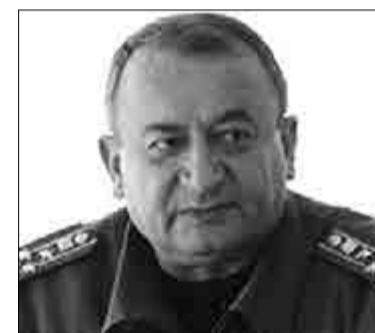
Արթուր Հարությունյան, Սյունիքի ՄՓԾ պետ