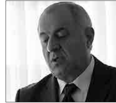
Հայկարամ Մխիթարյան, ՀՀ ԱԻ նախարարի տեղակալ