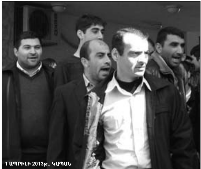
1 ԱՊՐԻԼ 2013Թ., ԿԱՊԱՆ

Ապրիլի 2-ին Կապանի մշա-կույթի կենտրոնի ծեռնարանում բացվեց ցուցահանդես՝ նվիրված հայ մեծանուն ճարտարապետ, ճարտարապետության ակադե-միկոս Ալեքսանդր Թամանյանի ծննդյան 135-ամյակին: Ցուցահան-դեսին ներկայացված են անվանի ճարտարապետի Հայաստանում եւ Ռուսաստանի Դաշնությունում կատարած աշխատանքները, անձ-նական իրեր, ընտանեկան 22 լուսանկար: «Կազմակերպված ցուցահանդեսը մեր համաքաղա-քացիների համար լավ հնարավոր-ություն է՝ մոտիկից ծանոթանալու տաղանդաշատ ճարտարապետի աշխատանքներին, նրա անձնա-կան իրերին, մեկ անգամ եւս գնա-հատելու նրա թողած ավանդը հայ ժողովրդի պատմության մեջ, - ցու-ցահանդեսի բացման հանդիսու-թյանը, մասնավորապես, ասաց Կապանի քաղաքապետ Աշոտ Հայրապետյանը: Ճարտարապե-տի ծոռը՝ Ալեքսանդր Թամանյանի անվան թանգարանի տնօրեն Հայկ Թամանյանը, ով եւս ներկա էր մի-ջոցառմանը, ասաց. «Նման ցուցա-դրությունների շնորհիվ այսօրվա երիտասարդներն ավելի կարժեւո-րեն այն ճարտարապետություն-ը, որը մենք ունեցել ենք, ու որը Թամանյանը հասցրել է մեզ՝ այն արդիականացնելով՝ կամրջելով մեր իրականությունը միջնադարի ավանդույթների հետ»: