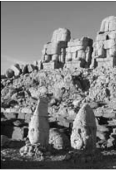
Նեմրուծի սրբավայրը Կոմագենում

առջելից ստացել է «3» հնչյունը, իսկ «իլա», «իլո» մասնիկները հետագայում են ավելացել արմատին՝ ունենալով փաղաքական իմաստ, Հնդկաստանում՝ Ռամը, որի անունը ըստ Մ.Գավուրջյանի՝ բխեցվում է Արամից: