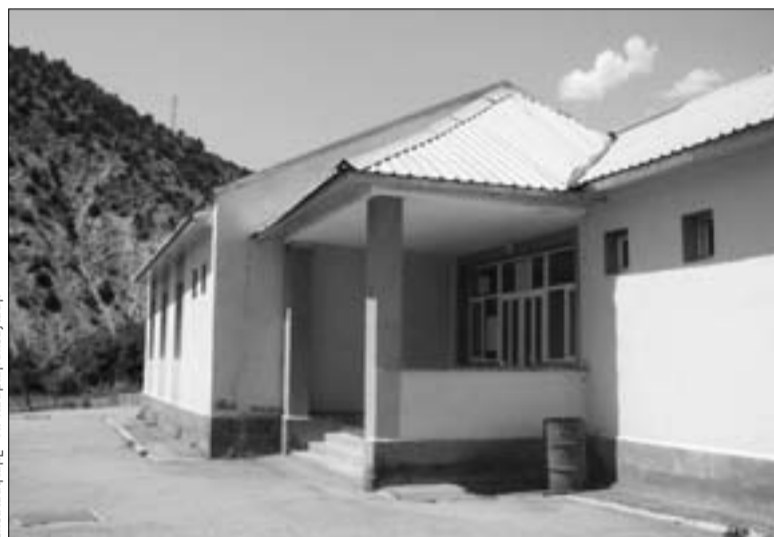
Նոնաձորի դպրոցի նորակառույց շենքը

Գյուղն առանց դպրոցի՝ Շիրազի բնորոշմամբ անլեզվակ զանգալի է նման: Համայնքի միջնակարգ