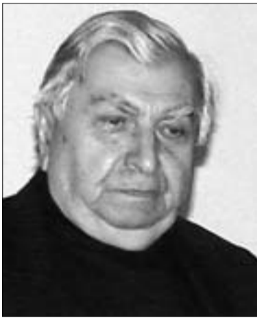
Գ. Ա. ԳԱԶԱՐՅԱՆ

ՀՀ ԳԱԱ թղթակից անդամ, Կրթության, Գիտության և մշակույթի նախարարի տեղակալ, ՀՀ Գիտության և մշակույթի նախարարի տեղակալի տեղակալ, ՀՀ Գիտության և մշակույթի նախարարի տեղակալի տեղակալ