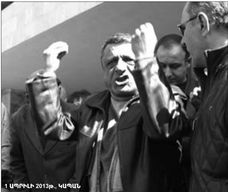
1 ԱՊՐԻԼ 2013Թ., ԿԱՊԱՆ