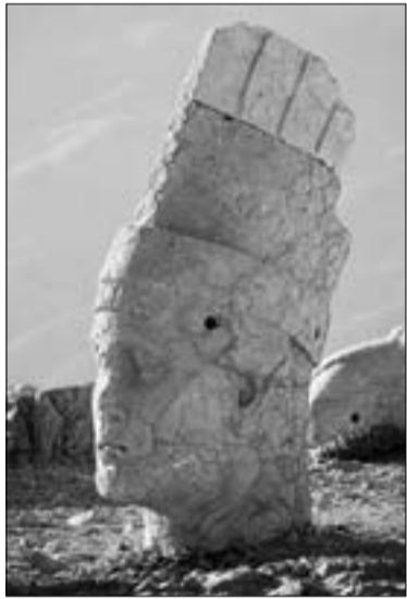
Նեմրուծի սրբավայր, Անտիոքոս 1-ին Երվանդունի, ով Ք.ա. 70թ. թագադրվել է Տիգրան Մեծի կողմից Հայկական կամ Տիգրանյան թագով