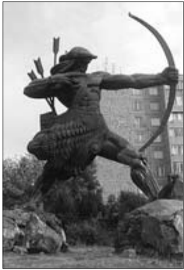
Հայկ Նահապետի արձանը Երեւանում

Շատ խոր հնության պատճառով դժվար է ճշտորեն որոշել Ար աստծո ինչպես ծագման, այնպես էլ նկարագրի զարգացման ժամանակաշրջանը: Գիտական ուսումնասիրությունները պարզել են, որ հնդեվրոպացիներն ունեցել են ակունքային մի ընդհանուր մշակույթ (հնդկական վեդաները, հայոց «Սասնա ծռեր» դյուցազնավեպը, իրանական «Ավեստան»), որը յուրաքանչյուր ժողովուրդը զարգացրել է յուրովի՝ բաժանվելով մայր ցեղից: Հնդկական «Ռիգվեդայում» եւ իրանական «Ավեստայում» աղոտ հիշողություններ են պահպանվել նախահայրերից զոհման արարչության /նաեւ Արաքս, Ռահ/ գետի մասին ՌԱՍԱ (Ռիգվեդա) եւ ՌԱՀԱ (Ավեստա) անունով: Տվյալ դեպքում Հայկական լեռնաշխարհի բնիկների՝ արիների համար գոյություն է ունեցել արեւի Ար աստծու պաշտամունքը, որը ցեղի գլխավոր աստվածն էր եւ ցեղի տարածման հետ տարածվել էր նաեւ նրա պաշտամունքը: Հնագիտական պեղումները, ազգագրական նյութերի ուսումնասիրությունները պարզել են, որ սկսած Ք.ա. 4-րդ հազարամյակից, արիական ցեղերը՝ շումերները, իսկ Ք.ա. 3-2-րդ հազարամյակից՝ հույներ, հնդիկներ, իրանացիներ, նոր բնակավայրեր ու նոր արտավայրեր փնտրելու նպատակով սկսել են հեռանալ նախահայրերից՝ Հայկական լեռնաշխարհից: Նրանք լավ կազմակերպված համայնքներ էին, լավ ռազմիկներ,