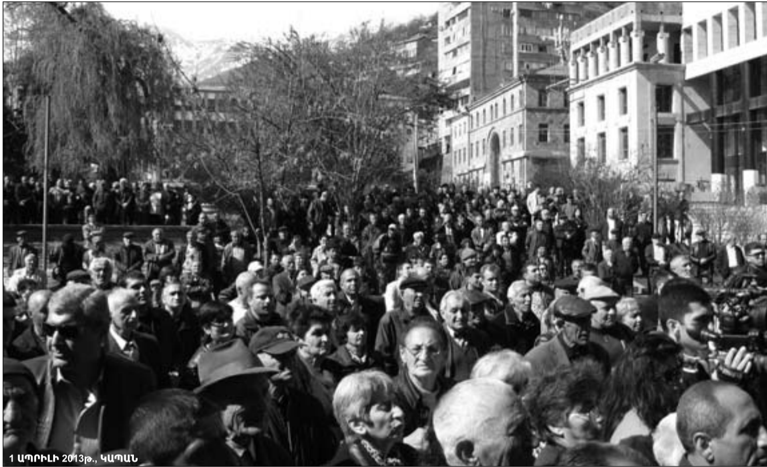
1 ԱՊՐԻԼԻ 2013Թ., ԿԱՊԱՆ

Ու կանգնած ենք ահա ապագայի հանդեպ Ջարմանալի՝ թեթեւ, զարմանալի՝ անդեմ՝ Մերկության պես տրկոր ու անանջյալ... ԵՂԻՇԵ ՉԱՐԵՆՑ