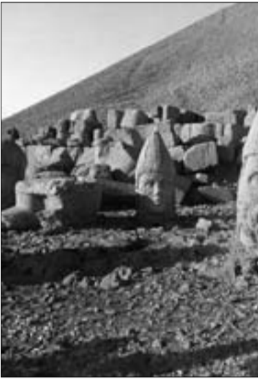
Նեմրուծի սրբավայրը Կոմագենում