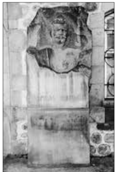
Ջորավարի հուշարձանը Գորիսի Մաշտոցի 19 փուն մուրթի մոտ

առաջարկն ու հոգու իմ ներքին մղումը, անբացատրելի պահանջն ասես համընկան իրար հետ: Դա հունվար ամսին էր, հայ ժողովրդի ծանր վշտի օրերին: Մեզանից յուրաքանչյուրն ակամա խոնարհվում էր իր արմատներին եւ փորձում գորեղացած հառնել: Պահանջ կար հերոսական ոգու, կերպարի արարման, հայ ժողովրդի գոյատեւման հավաստի վկայակոչման: