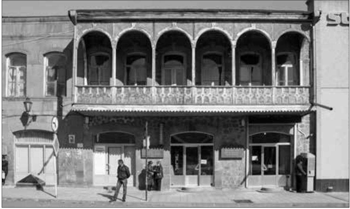
Գորիս քաղաքի Մաշտոցի 19 փունը, որպեղ ապրել է Ջորավարը

Ինչ-որ մեկը ինչ-որ տեղից պեղել է կամ ինչ-որ մեկի ականցովն է ընկել, որ, ասենք, Ուրուզվայի երիտասարդության, տուրիզմի եւ սպորտի նախարարը հայուհի է, ու այդ «սենսացիոն» լուրը իսկույն տեղ է գտնում հայկական լրատվամիջոցների առաջին էջերում, տողերում, կայքերում... Մի քանի օր շրջանառվում է՝ մինչեւ հաջորդ «սենսացիոն» լուրը, իսկ այն հետեւյալն է. «Բարսեւլունայի» հայտնի հարձակվող այսինչի առանձնատունը մի հայ է գնել: Սրան էլ փոխարինելու է գալիս հաջորդ «հայտնագործությունը»: Ընդունելով որպես հիմնավորված տարրերի պարբերական համակարգի՝ Մենդելեևի կողմից երազում հայտնագործված լինելու փաստը, իրենք էլ իրենց հերթին են մի նոր հայտնագործություն կատարում: Իմաստը հետեւյալն է՝ Մենդելեևից մոտ 1500 տարի առաջ դա հայտնագործել է ոչ ավել ոչ պակաս մեր համաբարձր՝ Մեսրոպ Մաշտոցը: Ըստ այս տեսության համահեղինակ Արմենուհի Փալանդուզյանի՝ ոսկի, մեղալգաթ, կլակ, արճիճ, սնդիկ բառերի տառերի այբուբենում հերթական համարների գումարը տալիս է տարրի կարգային համարը: Օրինակ, ոսկի բառի տառերի՝ հերթական համարներն այբուբենում համապատասխանաբար 29, 29, 15 եւ 11 է, որոնց գումարը՝ 79, ինչպիսին ոսկի տարրի կարգային համարն է պարբերական համակարգում: Իրենց «հայտնագործությունը» ընդհանրացնում են հետեւյալ կերպ. «Այժմ մնում է մտածել՝ Մենդելեևի երազում հայերենը որեւէ դեր խաղացե՞լ է, թե՛ արարիչը տեսնելով, որ մեր հիմնավորը լեզվի ու այբուբենի մեջ գաղտնագրված գիտելիքն այդպես էլ մարդկության սեփականու-ՇՆՈՒՆԱԿՈՒԹՅՈՒՆ ԷՑ 8