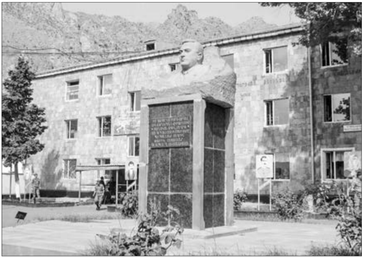
Ջորամասի առաջին հրամանատար, գնդապետ Ղեւոնդ Յովհաննիսյանի կիսանդրին գնդի տարածքում

Նրա վաստակն էլ աննկատ չի մնացել: Այս տարվա հունվարի 28-ին՝ հայկական բանակի կազմավորման օրը, հանրապետության նախագահի ձեռնադր ստացավ «Արիության» մեդալ: Որպես երկարամյա զինվորական՝ նրանից հետաքրքրվեցինք, թե իր ծառայության տարիներին ինչ է փոխվել գնդում: Մեր զրուցակիցն էլ փոխանցեց, թե թիկունքային