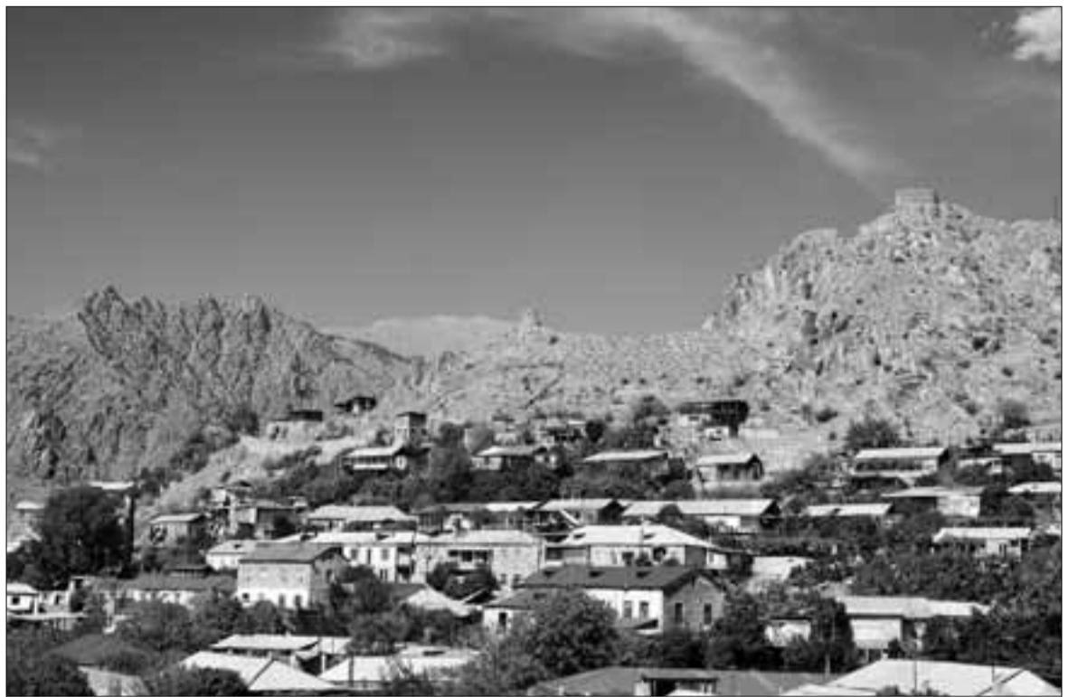
ՆՈՒՍՏԱՎԱՐԸ. Գ. ԱՄԻՆՅԱՆ

Հատկապես մեծ վտանգ են ներկայացնում և ջրի աղտոտման հիմնական պատճառ են հանդիսանում Թխկուտ գյուղի մոտ՝ անմիջապես Մեղրի գետի ողողատում գտնվող Լիճքավազ-Թեյի ոսկու հանքավայրի արդյունաբերական թափոնների լցակույտերը, որոնք ուղղակի անտեղության են մատնված: Այդ հանքավայրը ժամանակին շահագործել է «Սիփան-1» ՍՊԸ-ն, այնուհետև ավստրալիական «Այբիիան Ռիսորսիզ» և «Թամայա Ռիսորսիզ» ընկերությունները: 2010 թվականից