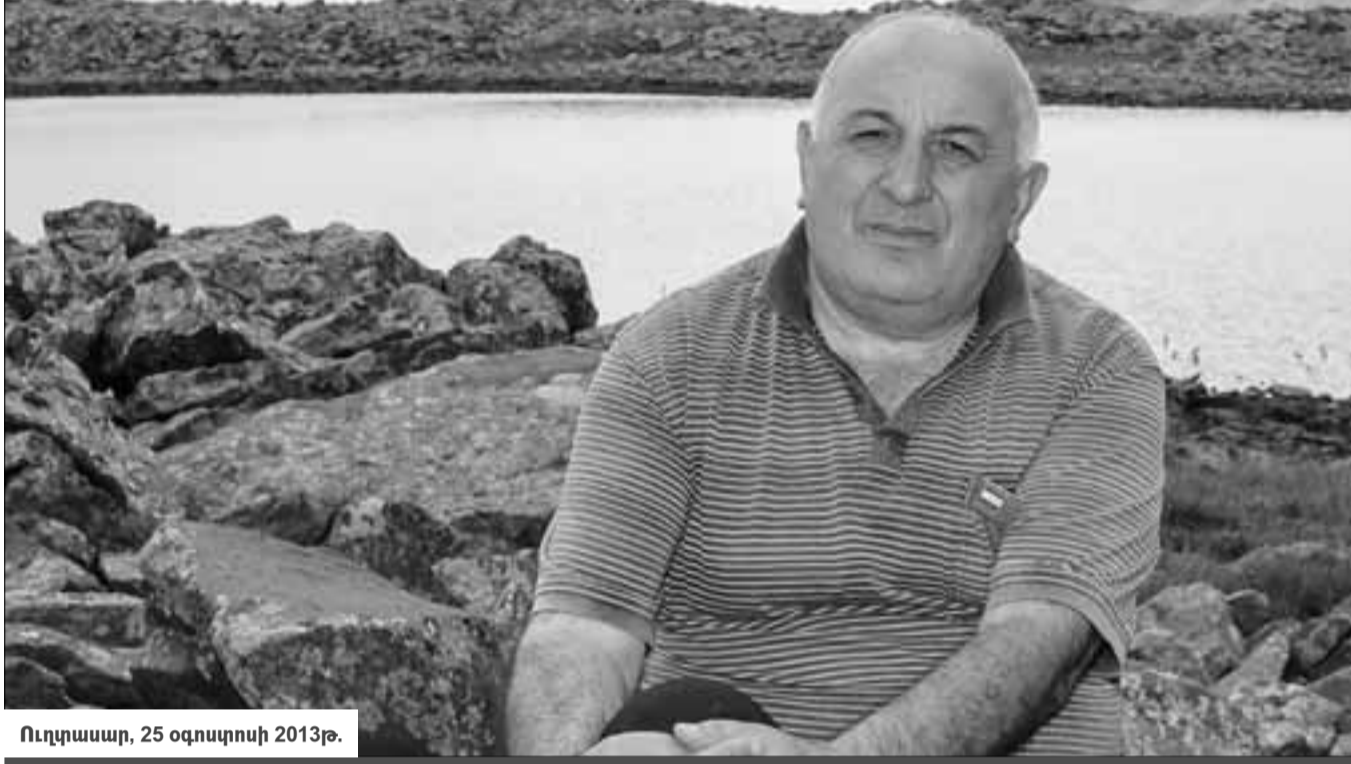
Ուղղաասար, 25 օգոստոսի 2013թ.