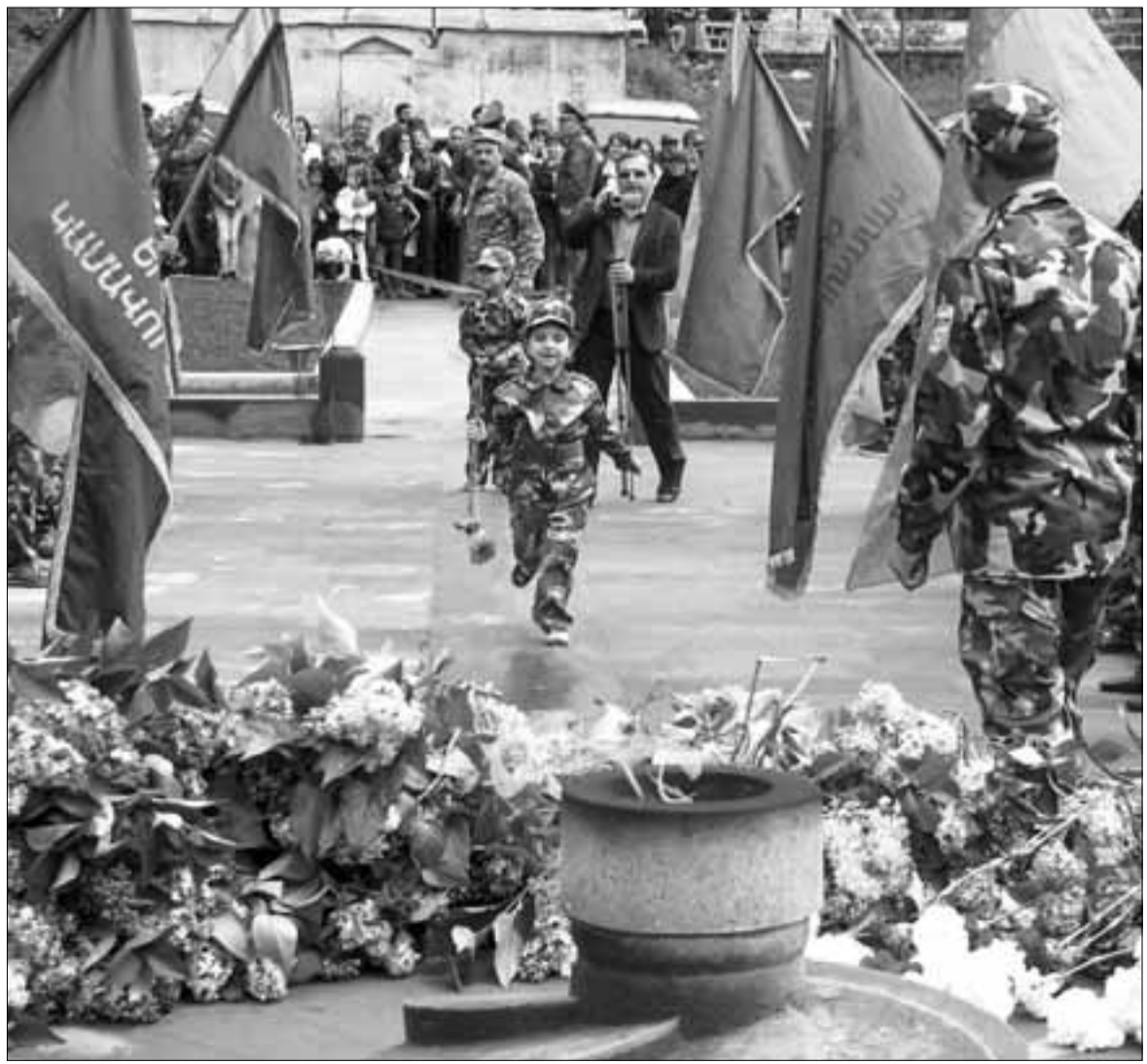
Մասնակցում է Ս. ՍՊՐՈՅԱՆՈՒ