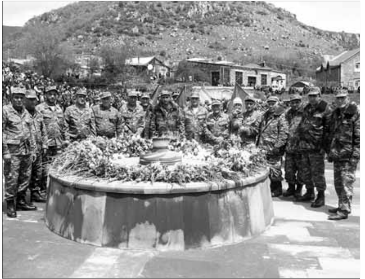
ԼՍԻՄԱԿԱՐԵ Ա. ՄՐԻՅԱՆՍԻ