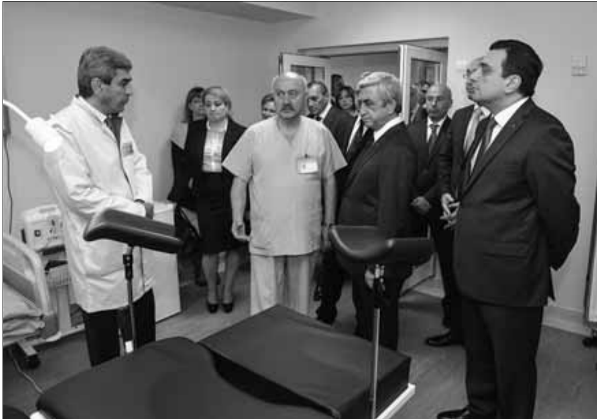
«Կապանի բժշկական կենտրոն» ՓԲԸ-ում, 13 հոկտեմբերի 2015թ.