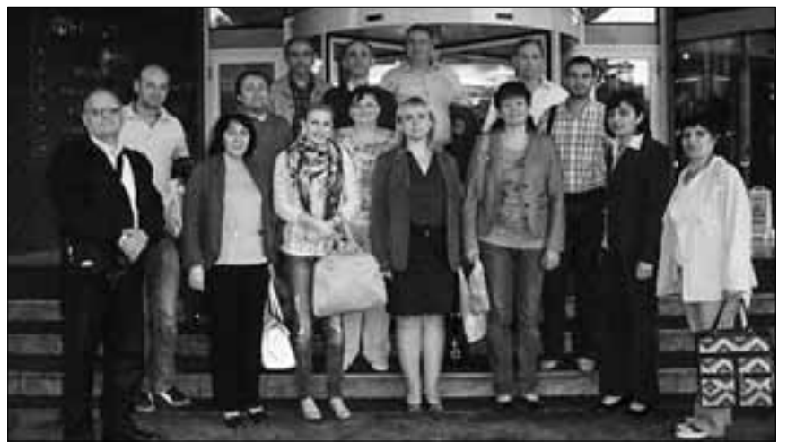
Բրատվի համալսարանում կազմակերպված վարժանքների մասնակիցները