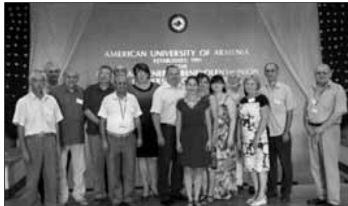
ICo-օր նախագծի 4-րդ խորհրդաժողովի մասնակիցները ՀԱՀ-ում (Երևան)