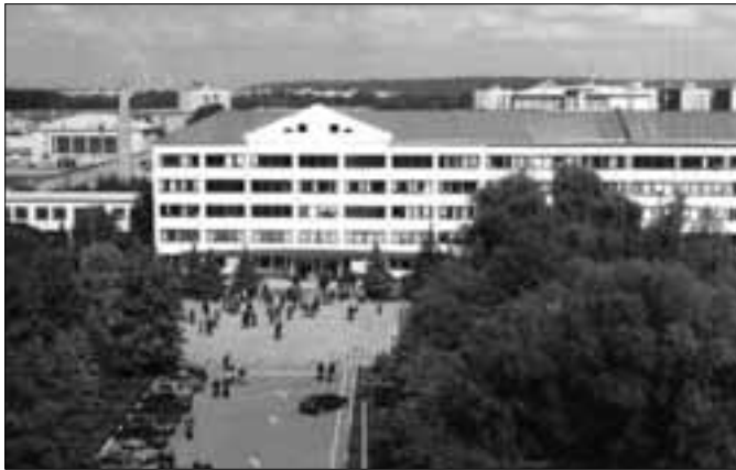
Իվանո-Ֆրանկովսկի նավթի եւ գազի տեխնիկական համալսարան (Ուկրաինա)