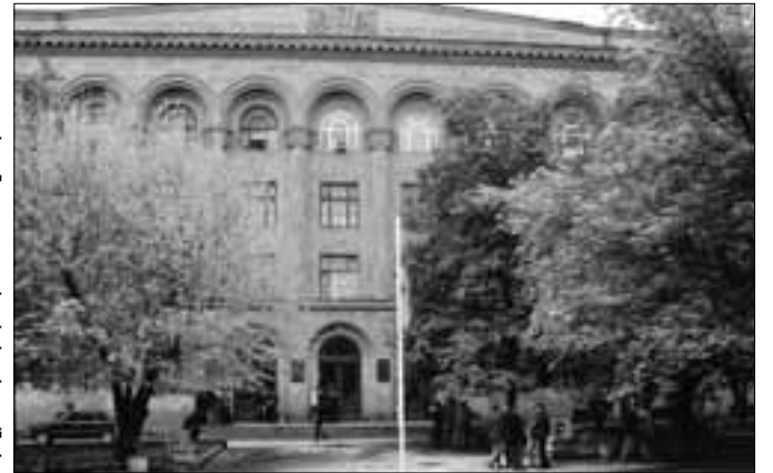
Հայաստանի ազգային պոլիտեխնիկական համալսարան

130-ամյա Դեուստոյի համալսարանը գտնվում է Բասկերի երկրի Բիլբաո քաղաքում եւ ունի մասնաճյուղ Սան Սեբաստիան քաղաքում: Բակալավրի, մագիստրոսի եւ հետազոտողի ծրագրերով համալսարանում սովորում են ավելի քան 10 հազար ուսանող բիզնեսի, տնտեսագիտության, իրավագիտության, ճարտարագիտության, սոցիոլոգիայի, մանկավարժության եւ հասարակագիտության մասնագիտություններով: Համալսարանը սերտ միջազգային համագործակցություն է հաստատել ավելի քան 200 համալսարանի հետ եւ գործում մասնակցություն է ունենում