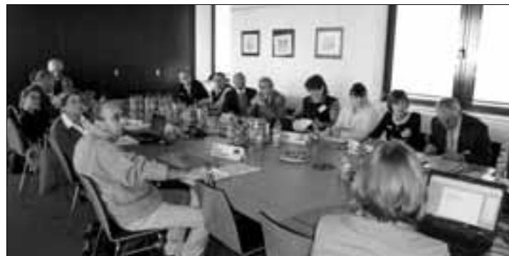
ICo-օր TEMPUS նախագծի մեկնարկային խորհրդաժողովի մասնակիցները Իլմենաուի տեխնոլոգիական համալսարանում (Գերմանիա)

Իլմենաուի, Դեուստոյի և Բրասովի համալսարանների կողմից առաջարկված երեք հեռավար լաբորատոր սարքավորումներից հայաստանյան բուհերը նպատակահարմար համարեցին ընտրել 24 հազար եվրո արժողությամբ Իլմենաուի տեխնոլոգիական համալսարանի ինտեգրացված հեռահաղորդակցության համակարգերի դեպարտամենտի մշակած GOLDI (Grid of Online Laboratory Devices Ilmenau) հեռավար ինտերակտիվ հիբրիդային լաբորատորիան: Այն առավելագույնս համապատասխանում է տարածաշրջանային աշխատաշուկայում պահանջված Կապանի մասնաճյուղի ՏՏ մասնագիտության ուղղվածությանը և հնարավորություն է ընձեռում ապահովել շրջանավարտներից պահանջվող հմտությունները և կոմպետենցիաները: