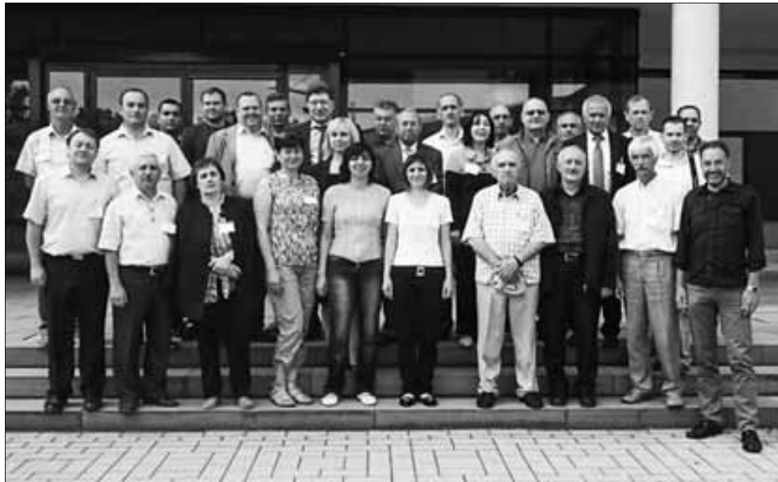
ICo-op TEMPUS նախագծի մասնակիցներն Իլմենաուի տեխնոլոգիական համալսարանում

Սննդամթերքի արտադրության նպատակով Հիմնականում ընդունվում է համալսարանում և արդյունաբերական կրթության նպատակով