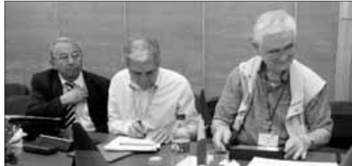
ICo-օր նախագծի 2-րդ խորհրդաժողովում (Խարկովի համալսարան)