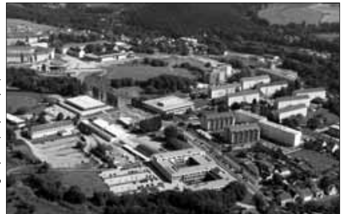
Իլմենաուի տեխնոլոգիական համալսարան (Գերմանիա)