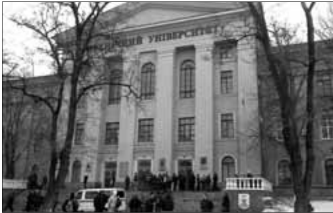
Ջապորոժիեի ազգային տեխնիկական համալսարան (Ուկրաինա)