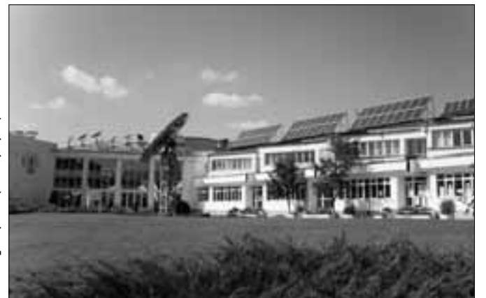
Բրասովի ՏՐԱՆՍԻԼՎԱՆԻԱ համալսարան (Ռումինիա)