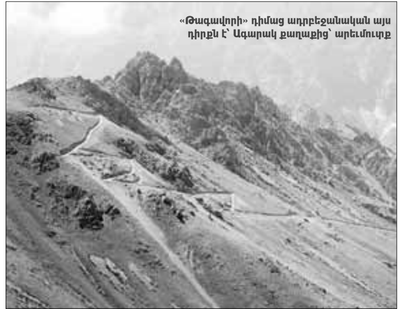
«Թագավորի» դիմաց ադրբեջանական այս դիրքն է՝ Ազարակ քաղաքից՝ արեւմուտք

– Ձեզ՝ բարի ծառայություն: Ջրույցը՝ ՎԱՀՐԱՍ ՕՐԲԵԼՅԱՆԻ