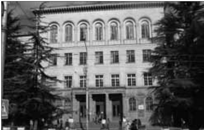
«Իլյա Ճավճավաձե» պետական համալսարան (Վրաստան)