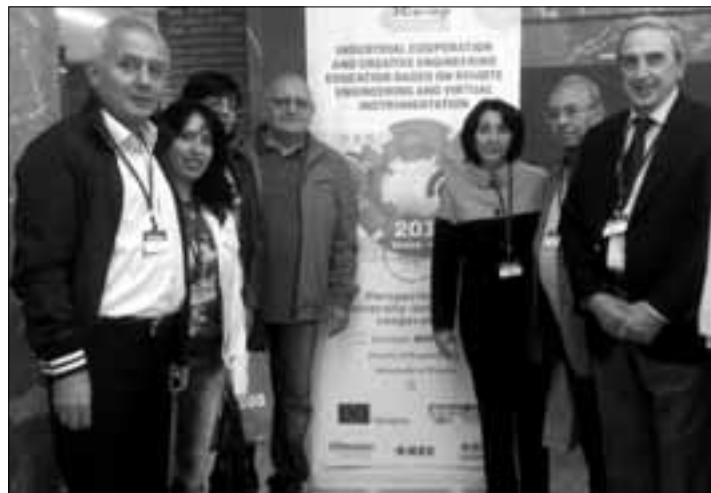
Ուսումնական մոդուլների քննարկում Վիլլախում (Ավստրիա)

2015թ. հոկտեմբերի 8-9-ին Դեոստոյի համալսարանում (Բիլբաո, Իսպանիա) տեղի ունեցավ Ico-op նախագծին նվիրված գիտաժողով, որին մասնակցեցին նախագծի մասնակից բոլոր բուհերի եւ գործընկեր ընկերու-