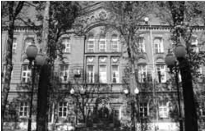
«Խարկովի պոլիտեխնիկական ինստիտուտ» / Ազգային տեխնիկական համալսարան (Ուկրաինա)

«Շոթա Ռուսթավելի» պետական համալսարանը հիմնադրվել է 1923թ. Աջարիայի մայրաքաղաք Բաթումում: Այն Վրաստանի ուսումնագիտական եւ մշակութային կարելու կենտրոններից է, որի ութ ֆակուլտետում իրականացվում է շուրջ 5000 ուսանողի ուսուցում՝ 43 բակալավրական, 23 մագիստրոսական եւ 8 հետազոտողի ծրագրերով՝ հետեյալ մասնագիտությունների գծով՝ բնական գիտություններ, ճարտարագիտություն եւ շինարարություն, հումանիտար գիտություններ, իրավագիտություն, հասարակագիտություն եւ այլն: Ուսումնական գործընթացներում ընդգրկված են 244 դասախոս, 55 գիտաշխատող եւ 387 իրավիճակ պրոֆեսոր: Համալսարանի գիտական ներուժը զգալիորեն աճեց, երբ 2006թ. մի քանի գիտահետազոտական ինստիտուտներ միավորվեցին համալսարանի հետ: Համալսարանը ներգրավված է մի շարք միջազգային ծրագրերում (Տեմպուս, Էրազմուս, Մուդրոս եւ այլն), որոնք ուղղված են կրթական չափորոշիչների, որակի, ինչպես նաեւ ուսանողների եւ դասախոսների շարժունության բարձրացմանը: