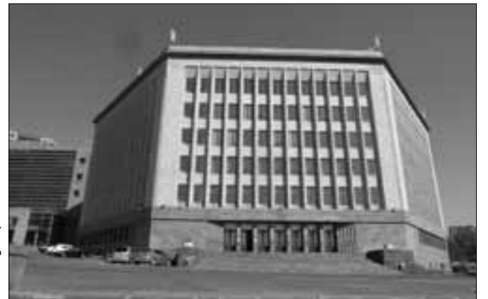
Հայաստանի ամերիկյան համալսարան