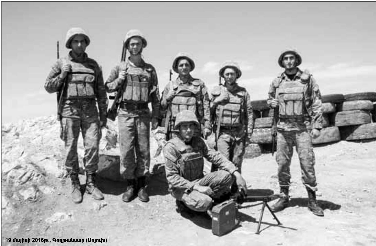
19 մայիսի 2016թ., Գողթանսար (Սոյուխ)

...ԹՅ ԱձՕ 3 1/2. 3 ԱՇԿ Է անՆաճո՞՞ն՝ Կ Շո՞՞ն՝ Կ ՆՅ Սի՞ 3 ի՞նչ ի՞նչ: ՆՅ Սի՞ 3 ի՞նչ Կ . 3 ի՞նչ ԵՄ՞՞նչ. »նՅ. ձՍՍԿ՞՞ ԱՇԿ ի՞նչ ՇԵ՞՞ն Կ Կձձձձձձ: ԹՅ Աձձ 2 1/4 1/2 ԱՇԿ Է անձձձձձ 30 ԱՇԿ ԱՇԿ 1918Թ.