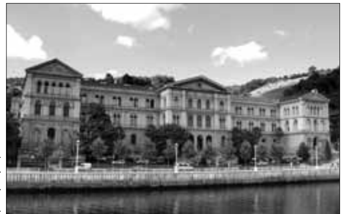
Դեուստոյի համալսարան (Իսպանիա)

Հայաստանի ազգային պոլիտեխնիկական համալսարանի կառուցման մասնաճյուղ