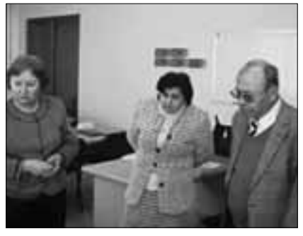
Վարժանքների կազմակերպում ՀՊԵՀ-ում