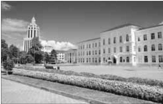
«Շոթա Ռուսթավելի» պետական համալսարան (Վրաստան)

Նայասանի ազգային տեխնիկական համալսարանի կառուցման մասնաճյուղ