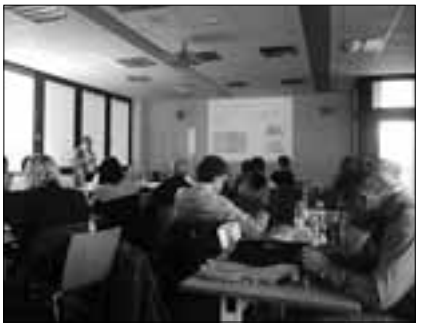
Վարժանքների անցկացումը Իվմենաուի համալսարանում

նական եւ լաբորատոր պարապմունքներով՝ օգտագործելով GOLDI լաբորատորիան, Quartus II եւ Atmel Studio բվային կառավարող համակարգերի ավտոմատացված նախագծման ծրագրային միջոցները: Տեսական նյութի ուսումնասիրությունն իրականացվում էր ինչպես ինքուրույնաբար՝ օգտագործելով մասնաճյուղի Moodle համակարգը, այնպես էլ շաբաթօրյա դասախոսությունների միջոցով: Ուսումնական պարապմունքների ավարտից հետո կազմակերպված քննությունների արդյունքում դրական գնահատականներ ստացած ունկնդիրներին տրվեցին միջազգային նմուշի վկայականներ: Ունկնդիրների եւ գործատուների հարցումների արդյունքները ցույց տվեցին, որ ինչպես ուսումնական մոդուլների մշակման մեթոդաբանությունը, այնպես էլ վարժանքների կազմակերպման եւ անցկացման մեթոդիկական հիմնականում ճիշտ է ընտրվել: Անցկացված փորձնական վարժանքների վերաբերյալ ունկնդիրների