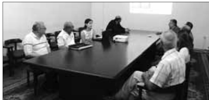
ICo-օր նախագծի 5-րդ խորհրդաժողովում (Բաթում)