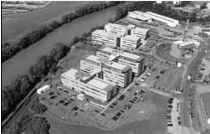
Քերնթենի կիրառական գիտությունների համալսարան (Ավստրիա)

Էլեկտրոնային ուսուցման գծով ազգային եւ միջազգային ծրագրերին: Շուրջ 1300 ուսանող եւ 50 դասախոս ներգրավված են ակադեմիական շարժունության ծրագրերում: Համալսարանում գործող WebLab-Deusto (www.weblab.deusto.es) հեռավար լաբորատորիան ինտեգրված է ուսումնական եւ վերապատրաստման գործընթացներում: Համալսարանում կազմակերպվել է հեռավար գիտափորձերի համար անհրաժեշտ մասնագիտական սարքավորման արտադրություն: