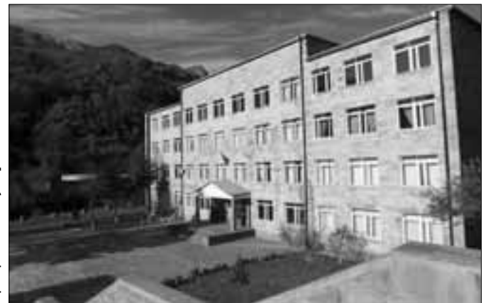
Հայաստանի ազգային պոլիտեխնիկական համալսարանի Կապանի մասնաճյուղ