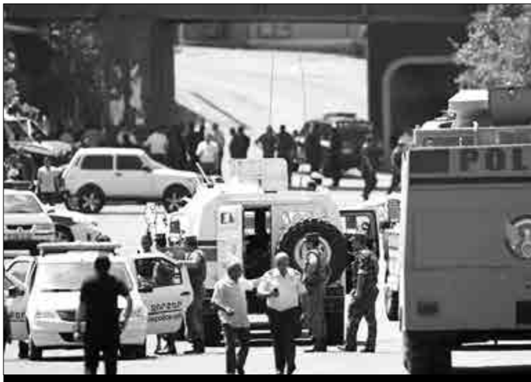
Ինչպես տեղեկանում ենք մայրաքաղաքային լրատվամիջոցներից, հուլիսի 23-ին ազատ են արձակվել ՊՊԾ գնդում պահվող պատանդ ոստիկանները:

Եջ 1 Բնութագրենք (փորձենք բնութագրել) կատարվածը, միեւնույնն է, իրողության բուն էությունը չենք կարող փոխել կամ աղավաղված ներկայացնել: Իսկ իրողությունն այն է, որ հուլիսի 17-ին բռնկված խռովությունը դանդաղ, բայց և հետեւողականորեն վերածվում է քաղաքական ճգնաժամի՝ սոցիալական բազմաթիվ բաղադրիչներով: