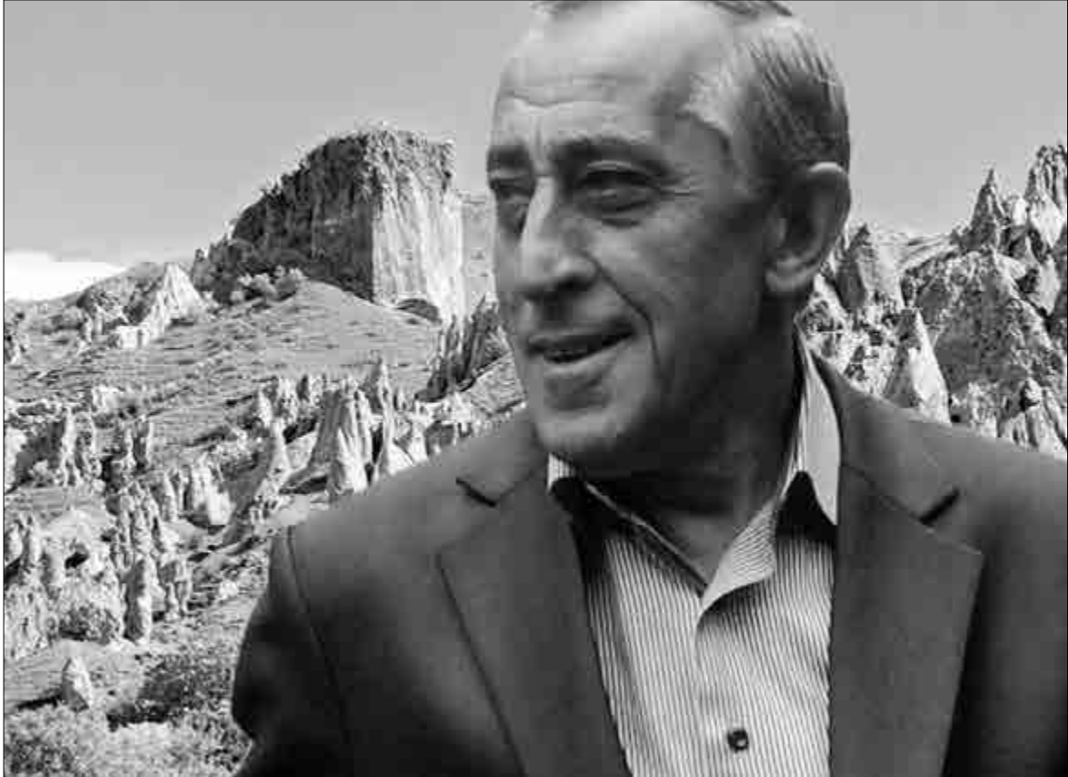
Եւ ուրախ օրերի գունարկ է, թե չէ «ընկերությունը դժվարությունների մեջ է փորձարկվում» ասացվածքը կդառնար անհմաստ:

« Դա մարդու համար «ընկերը» բացարձակ արժեքներից մեկն է, այն համարյա գտնվում է ընտանիք, սեր հասկացությունների հետ միեւնույն հարթության վրա: Ասում ենք՝ ասա՝ ո՞վ է ընկերդ, ասեմ՝ թե դու ով ես, կամ՝ ինչպիսի՞ն է եղբայրս՝ չգիտեմ, հետն ընկերություն չեմ արել: Նպատակ չունեմ ընթերցողին դասախոսություն կարդալ այս թեմայով, ուղղակի ցանկանում եմ նրան մասնակից անել մտորումներին: Ընկեր ծարել, գտնելը դժվար չէ: Այն պահելն է դժվար: Դասկանալի է, «պահելը» հասկանում ենք ոչ ուղիղ իմաստով: Ոչ մի ընկերություն միայն լավ