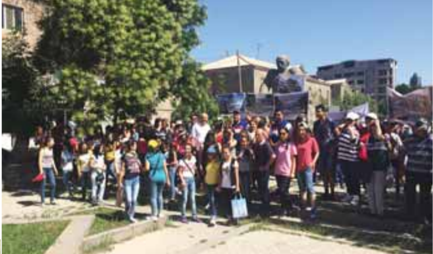
Յոթ փարի շարունակ Սիսիանում ԼՂՎԵԿ երիտասարդության օրը