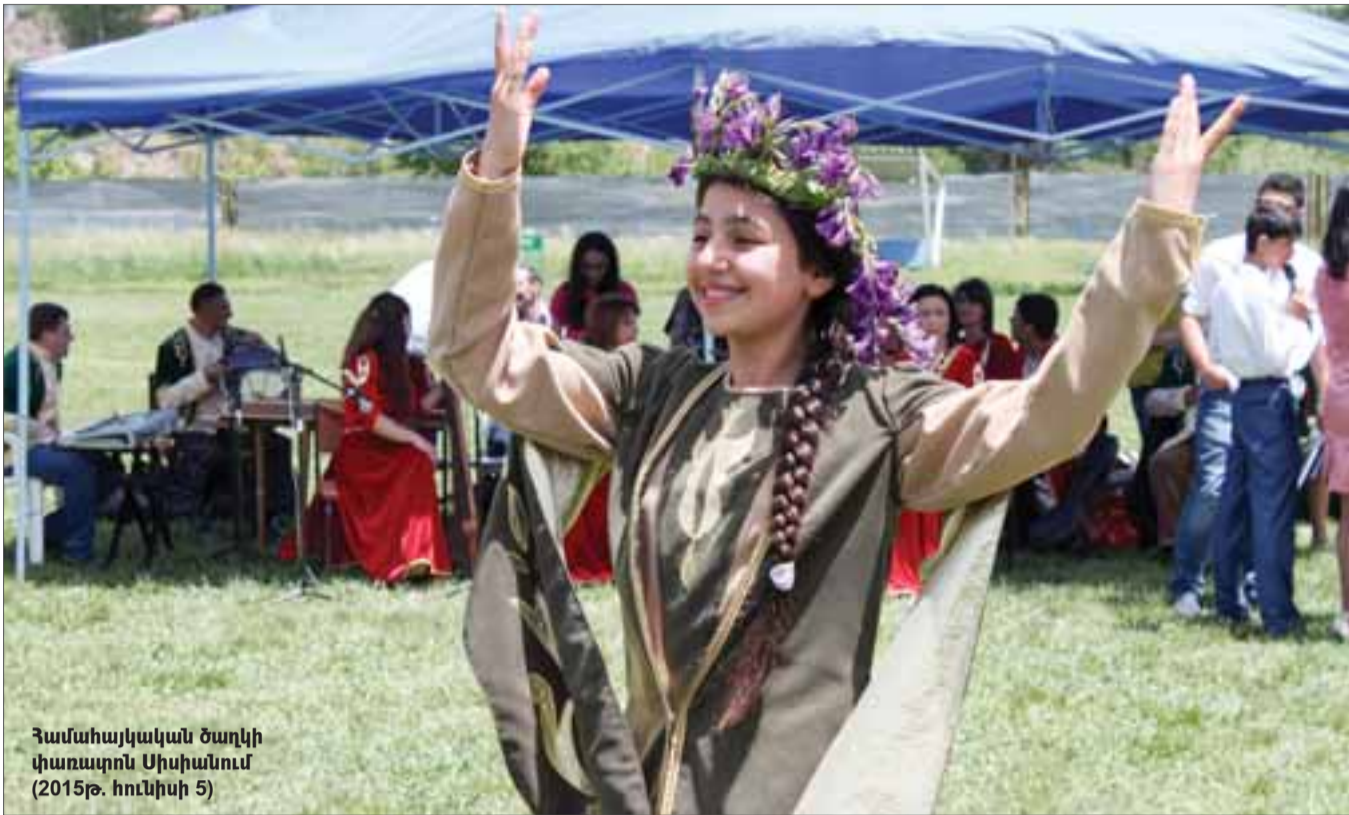
Համահայկական ծաղկի փառատոն Սիսիանում (2015թ. հունիսի 5)