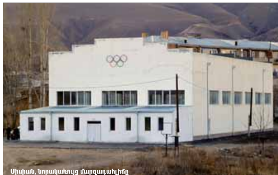
Սիսիան, Նորակառուց մարզադահլիճը

Ցավոք, այն ամենը, ինչի մեջ հայտնվել ենք, նաեւ դուրս է բնության օրենքներից,