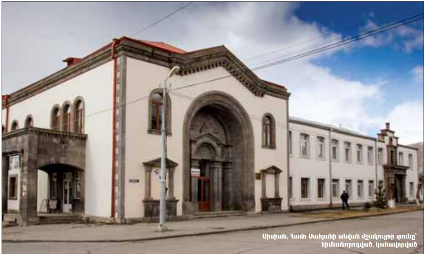
Սիսիան, Համո Սահյանի անվան մշակույթի տունը՝ հիմնանորոգված, կահավորված

Ոչինչ չես կարող ասել, մասնագետ հոգեբանի, դաստիարակչի անթերի պատասխան էր, որից էլ միասին ու թեթեւ օր-