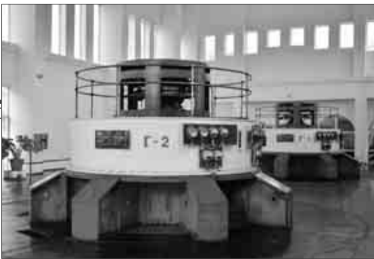
Սպանդարյան հէկ-ի մեքենայական սրահ

պահին, օգտագործված արտադրական մարտկոցներն են, որոնք դեռևս դուրս չեն եկել արտադրությունից: Վերազինման ծրագրի շրջանակներում հնարավոր թափոնների գոյաց-