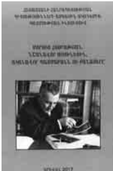
Երկրամասը կրկին լուսավորելուց հետո դարեր ի վեր վառ պահեցին այդ լույսը:

Շարունակում ենք ներկայացնել Այունյաց աշխարհի այն գավառներին, ովքեր սուրբ եւ բազմերանգի մարդու՝ Մաշտոցի՝ Այունիք գալուց եւ տեղումնական մեր