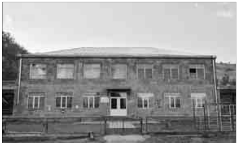
Շամբ գյուղի մանկապարտեզ