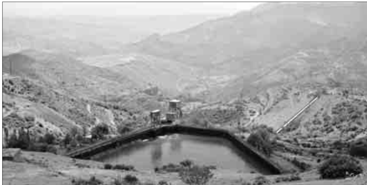
ԶԳՀԿ օրվա կարգավորման ջրամբար