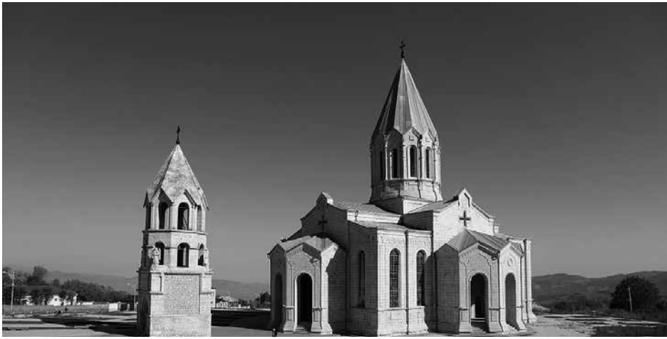
Շուշիի Սուրբ Ամենափրկիչ Ղազանչեցոց մայր տաճար