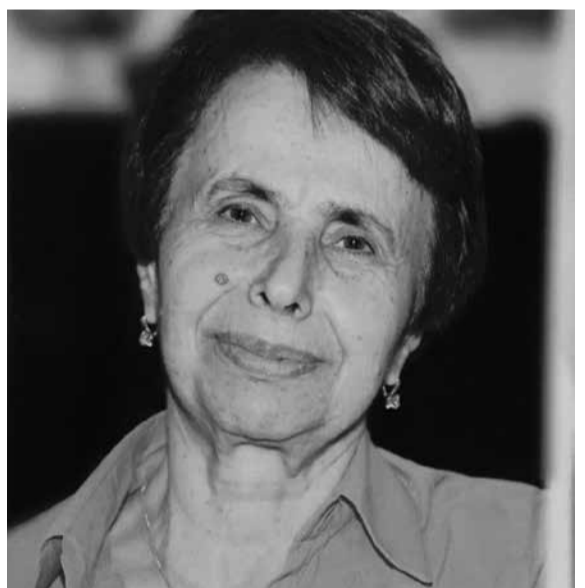
Կյանքից: Լույս լինի նրա շիրիմին:

Մի շարք վիրահատություններ էր տարել՝ վերջին տարիներին առողջությունը վատթարացել էր: Մարտի 25-ին էլ՝ իր հետեւից թողնելով միայն բարի հիշատակ եւ ջերմ հիշողություններ ամուսնուն, հեռացավ երկրային