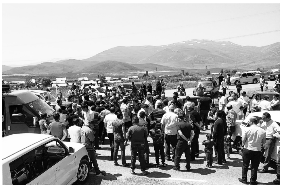
2019 թվականի հունիսի 30-ին անցկացնել Սյունիքի մարզի Գորայք համայնքի ղեկավարի ընտրությունների վերաքվեարկություն:

Համաձայն Գ. Սյունիքի մարզի 118-րդ հողվածի 8-րդ կետի՝ համայնքի ղեկավարի ընտրությունների անվավեր ճանաչվելու դեպքում քվեարկության օրվանից 21 օր հետո թեկնածուների նույն կազմով անցկացվում է վերաքվեարկություն: Գիմք ընդունելով վերոնշյալը՝ թիվ 34 տարածքային ընտրական հանձնաժողովը հունիսի 25-ին կայացած նիստում որոշել է