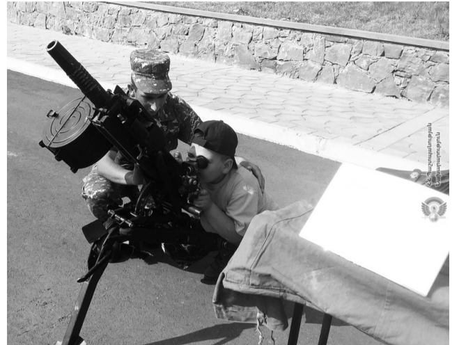
Հունիսի 23-ին 1-ին զորամիավորման ենթակայությանը գործող զորամասերը Գործիս եւ Կապան քաղաքներում ցուցադրել են սպառազինության եւ զինվորական տեխնիկայի նմուշներ: