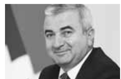
Դուլյան Ազոտ Վլադիմիրի