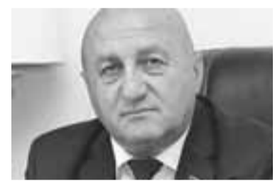
Իսրայելյան Ռուսլան Էդուարդի

Բուքիբիոն մտահոգություն է հայտնել Հայաստանի Սահմանադրական դատարանի շուրջ ծավալվող բաց առձակատման առնչությամբ: «Ես կիսում եմ Եվրոպայի խորհրդի խորհրդարանական վեհաժողովի համազեկուցողների մտահոգությունը այդ հարցում», - նշել է նա: Վենետիկի հանձնաժողովի ղեկավարը հիշատակել է 2019թ. հոկտեմբերին Վենետիկի հանձնաժողովի եզրակացության մեջ տեղ գտած առաջարկներն այն մասին, որ Սահմանադրական դատարանում վաղաժամ թռչակի անցնելու ցանկացած սխեմա պետք է խիստ կամավոր հիմունքներով լինի, բացառի ցանկացած քաղաքական կամ անձնական ճնշում դատավորների վրա, եւ պետք է մշակվի այնպես, որ չազդի ընթացքի մեջ գտնվող գործերի արդյունքի վրա: «Վերջին հայտարարությունները եւ ակտերը չեն համապատասխանում այդ չափանիշներին եւ չեն նպաստում լարվածության լիցքաթափմանը», - նշել է նա: Նրա խոսքով՝ ժողովրդավարության մշակույթը եւ հասունությունը պահանջում են ինստիտուցիոնալ զսպվածություն, բարեխղճություն եւ փոխադարձ հարգանք պետական ինստիտուտների միջև: Բուքիբիոն կրկին Հայաստանում բոլոր կողմերին կոչ է արել դրսեւորել զսպվածություն եւ թուլացնել լարվածությունը՝ «Հայաստանի Սահմանադրության նորմալ գործունեության ապահովման նպատակով»: