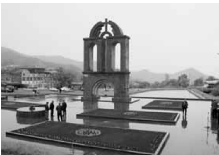
Արցախյան գոյամարտի նահատակների հիշատակը հավերժացնող հուշակոթող Գորիսում (2016թ.)

Հենց նրանց շնորհիվ էր նաեւ, որ Մեծ հաղթանակին միացավ մյուս հաղթանակը՝ Շուշիի հաղթանակը: