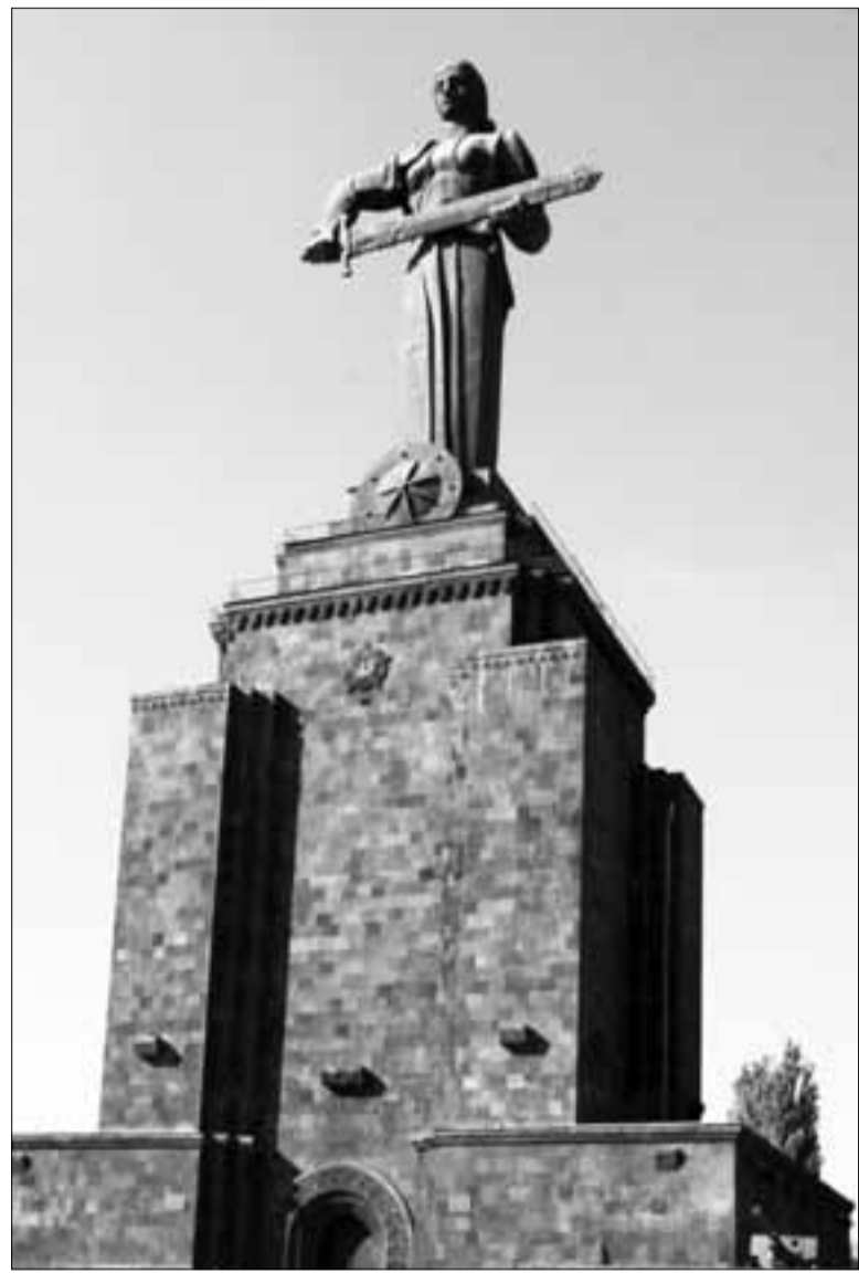
Մայր Հայաստան հուշահամալիրը Երեւանում (1967թ., քանդակագործ՝ Արա Չարությունյան)

Հայրենական մեծ պատերազմի տարբեր ռազմաճակատներում հայ ժողովրդի զավակներն աչքի ընկան թե՛ որպես զորահրամանատարներ, եւ թե՛ որպես շարքային զինվորներ: Մասնակցելով պատերազմի բոլոր խոշորագույն ճակատամարտերին՝ նրանք, հավատարիմ հայրց մարտական ոգուն, բարձր պահեցին մեր ժողովրդի պատիվն ու արժանապատվությունը: Հազարավոր հայեր մասնակցեցին Մոսկվայի պաշտպանությանը, իսկ ապագա մարշալ Յ. Բաղդամյանն այդ ծանր օրերին գլխավորում էր Հարավարեւմտյան ռազմաճակատի աջ թևում մարտնչող ռազմաճակատային օպերատիվ հարվածային խմբավորման շտաբը: Ավելի քան 30 հազար հայ մասնակցեց Ստալինգրադի ճակատամարտին, 10 հազարը՝ Կուրսկի ճակատամարտին: Կուրսկում եւս իրենց հրամանատար-