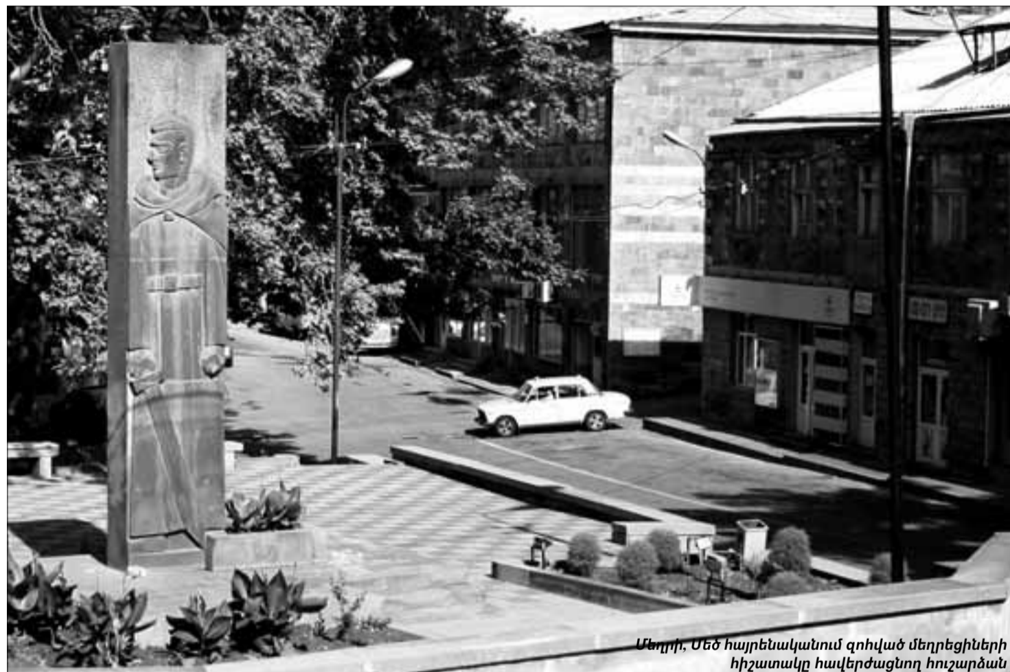
Մեղրի, Մեծ հայրենականում զոհված մեղրեցիների հիշատակը հավերժացնող հուշարձան