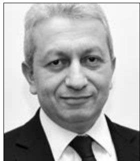
ԱՏՈՒ ՋԱՆՏՈՒՂԱՅԱՆ ՀՀ ֆինանսների նախարար