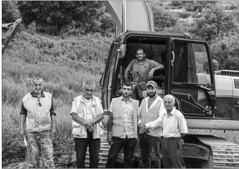
Դեռևս անցած տարվա վերջին նախատեսվել էր հիմնանորոգել Մեղրու տարածաշրջանում U-2 միջպետական ճանապարհի 10 կիլոմետրանոց հատված՝ Այգեծորի խաչմերուկից սկսած մինչև Մեղրի: Հայտարարված մրցույթում, որ վերջերս է կայացել, հաղթող է ճանաչվել Մեղրու «ՃՇՇ» ՍՊ ընկերությունը: