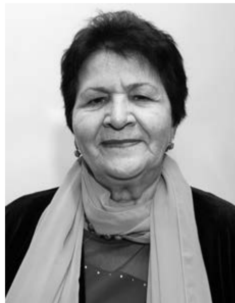
աստղաբույ: Պատվարժան տիկինը յուր ժամանակին

Քաղաքը բազմահարկ շենքերի, ավտոմեքենաների, գլխարկների վայրերի լիությունը չէ: Քաղաքը՝ մտածելակերպ է, ապրելու ձև, հյուր եկած քաջանուն մարդկանց