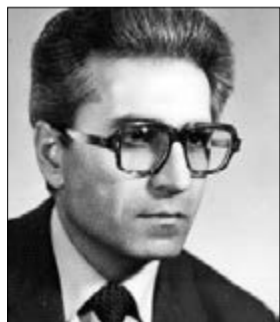
ՔՐԻՏՈՍ ՆԱԶԱՅԱՆ Պրոֆեսոր

Հարգելի խմբագրություն, հունիսի 19-ին լրանում է Հայաստանի ազգային պոլիտեխնիկական համալսարանի պրոֆեսոր, տեխնիկական գիտությունների դոկտոր Սեյրան Շամիրի Բալասանյանի ծննդյան 75-րդ համարակալված ամյակը: