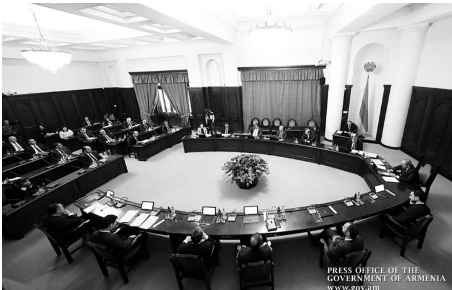
PRESS OFFICE OF THE GOVERNMENT OF ARMENIA www.gov.am

Ու եղավ ստի հրավառություն, Ու խաբեության հարսանիք եղավ... Ու կյանքս եղավ անվերջ դառնություն, Եվ արվեստիս տունն անտանիք եղավ: