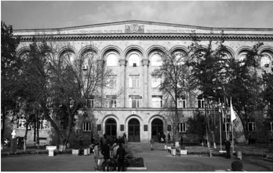
Հայաստանի ազգային պոլիտեխնիկական համալսարանի շենքը Երեւանում