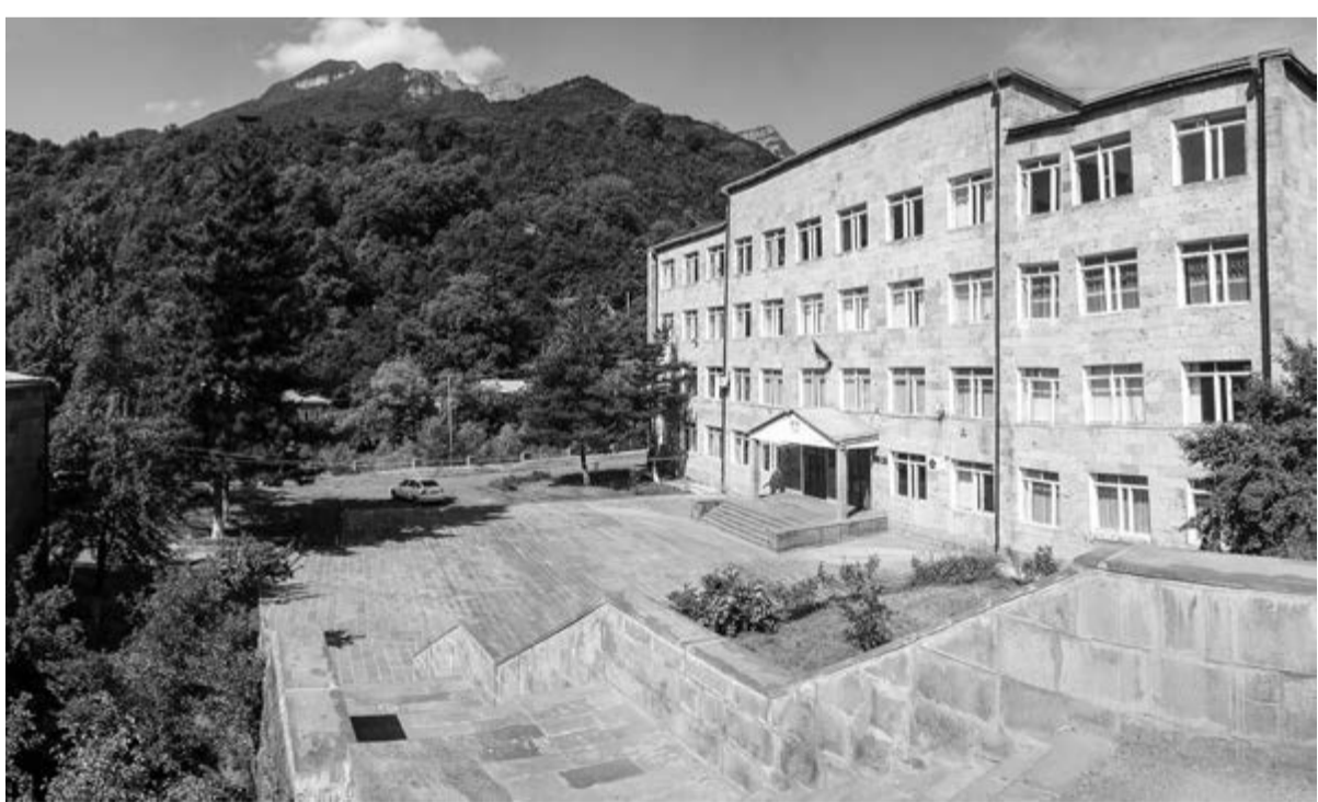
ՀԱՊՀ Կապանի մասնաճյուղը

Արգասաբեր է Ս. Բալասանյանի գիտահետազոտական գործունեությունը: Նրա ղեկավարությամբ գործող գիտական խումբը